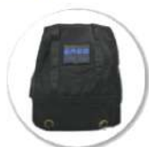
SAC DE PORTAGE