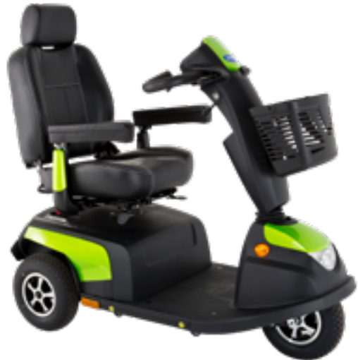
Orion PRO 3 roues