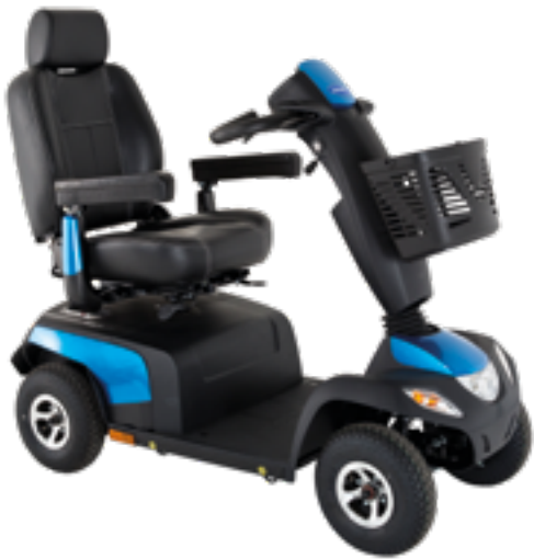
Orion PRO 4 roues