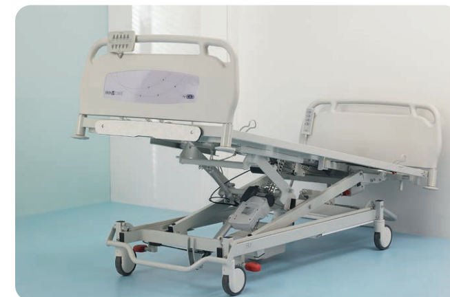
DÉCLIVE -12° Actionnable quelque soit la position du lit et quelque soit les conditions (avec ou sans électricité).