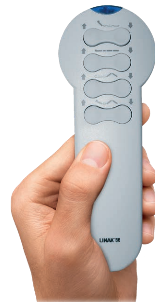
Deux télécommandes infra-rouge (en Option)