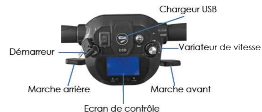
Tableau de contrôle