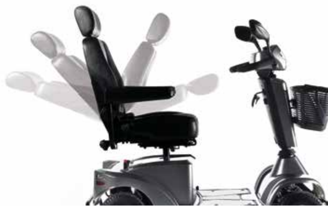
→ Inclinaison de dossier rapide