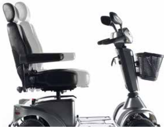
→ Réglage en profondeur continu

Le système d'assise des scooters S-SERIES, comporte ces petits secrets qui font le confort de vos voyages. De son réglage en hauteur, en profondeur et en inclinaison jusqu'aux accoudoirs relevables et ajustables en profondeur, chaque trajet est un moment de confort inoubliable!