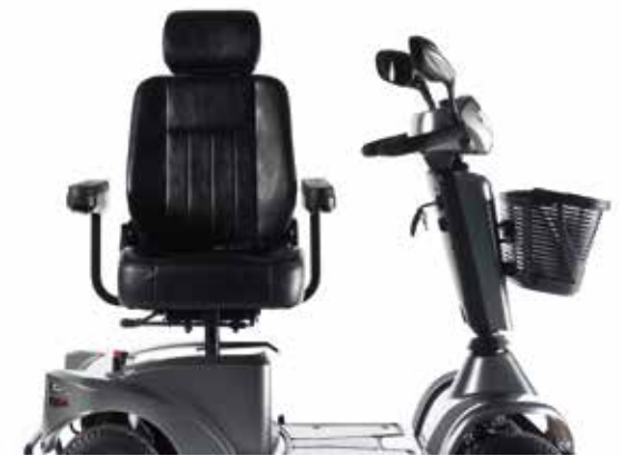
→ Siège pivotant pour des transferts facilités